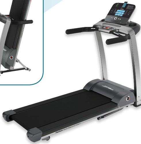
Mostrada con la consola Track